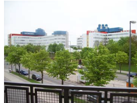
As seen from subway station